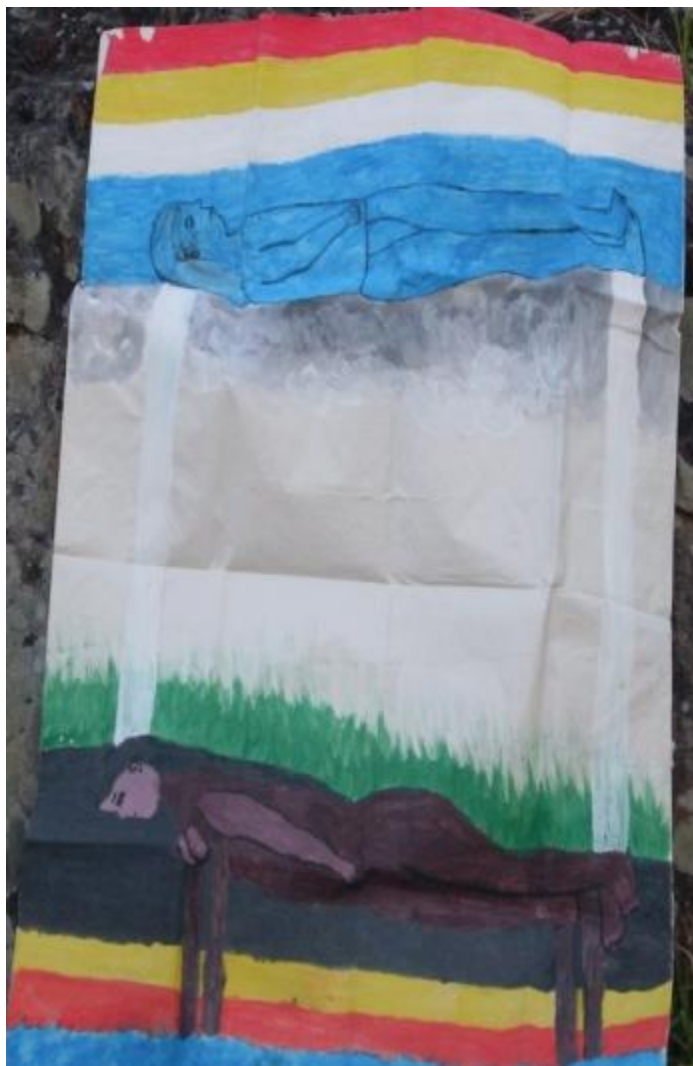
“Representación de la Cosmovisión del Pueblo U’wa, realizado por la Comunidad para la Elaboración del PEC”

abajo existen por las oposiciones, “[...] el de arriba es seco, masculino, es el papa frío e infértil, y el de abajo es húmedo, femenino, es la mamá caliente y fértil.” (Plan de salvaguarda U’wa, p.22).