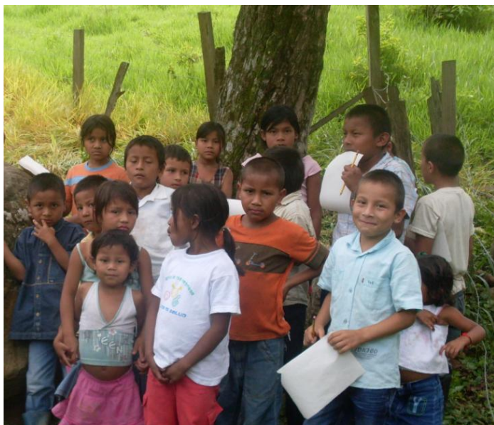
Archivo fotográfico Dirección de Poblaciones, Ministerio de Cultura. 2009.

El pueblo indígena U'wa, que significa gente inteligente que sabe hablar, ocupa hoy gran parte del ecosistema natural de la Sierra Nevada del Cocuy, del piedemonte de la Cordillera Oriental de los Andes y las sabanas planas del departamento de Arauca. Además, este grupo está presente en los departamentos de Boyacá, Santander, Norte de Santander y Casanare.