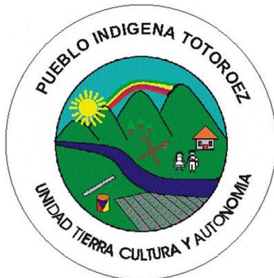
Imagen tomada de “Plan de salvaguarda étnica y cultural del pueblo indígena Tontotuna”.