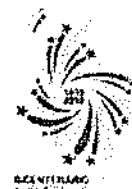
YOLANDA BARRAZA MOSCARDÓ Pasaporte AAF028582L