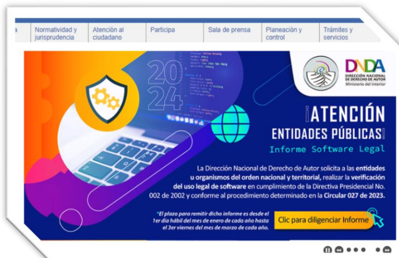
Imagen N° 1