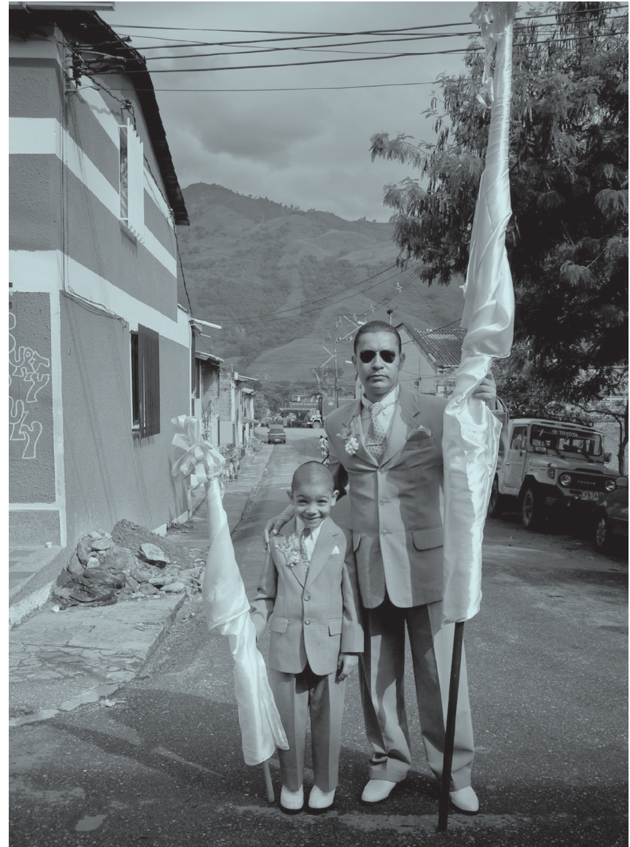
Genética 1 , Andrés Federico Ruiz Tobón, Barbosa, Antioquia, 2007. Premio Nacional de Fotografía del Patrimonio Cultural, 2009.