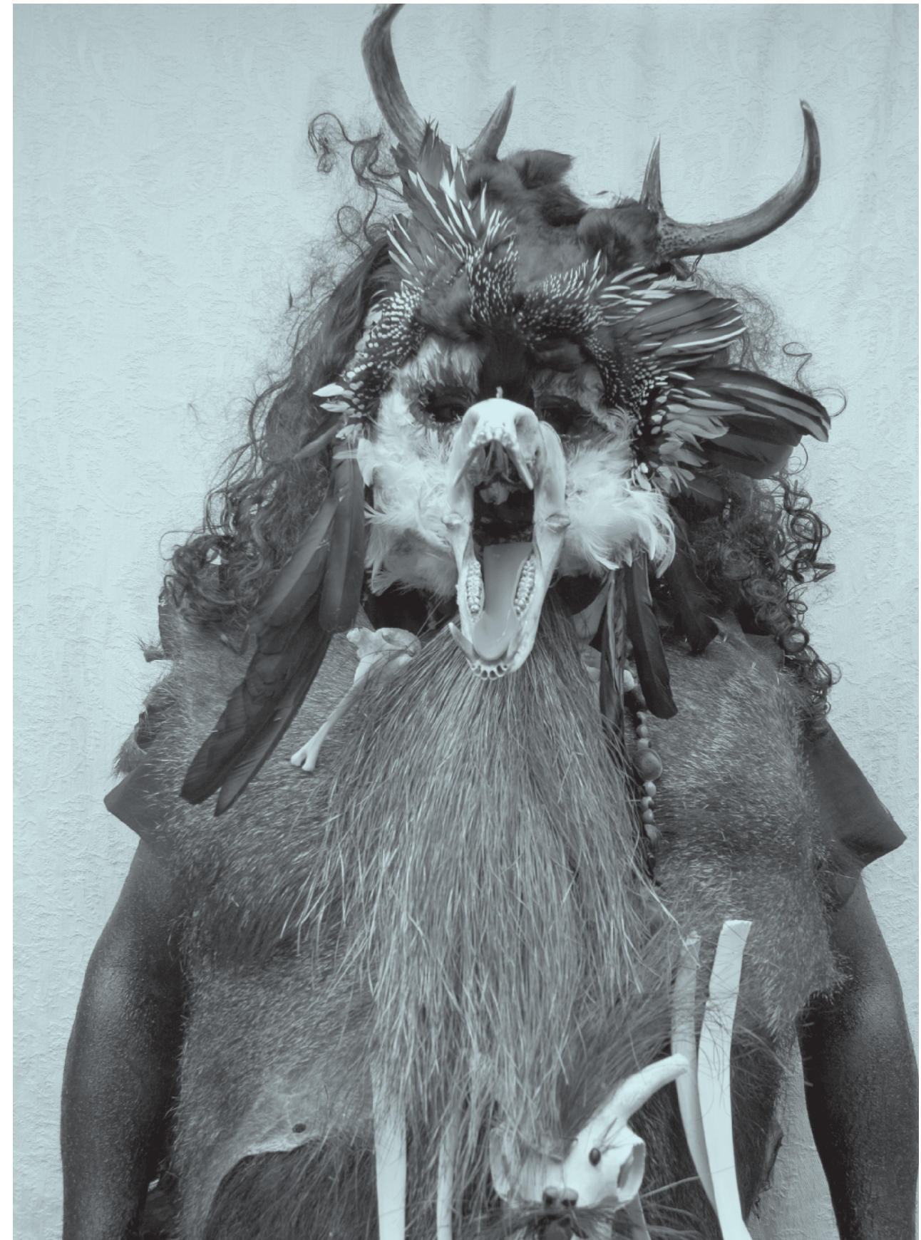
Sin título, Johana Marcela Toro Mora, San Martín, Meta (Cuadrillas de San Martín). Premio Nacional de Fotografía del Patrimonio Cultural, 2009.