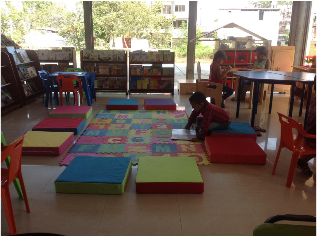
Sala de lectura, Colombia.