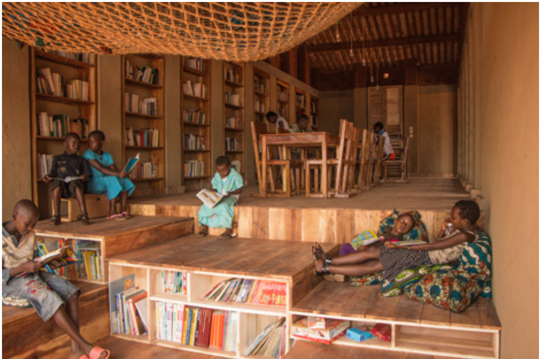
Biblioteca de Muyinga, Burundi, África.