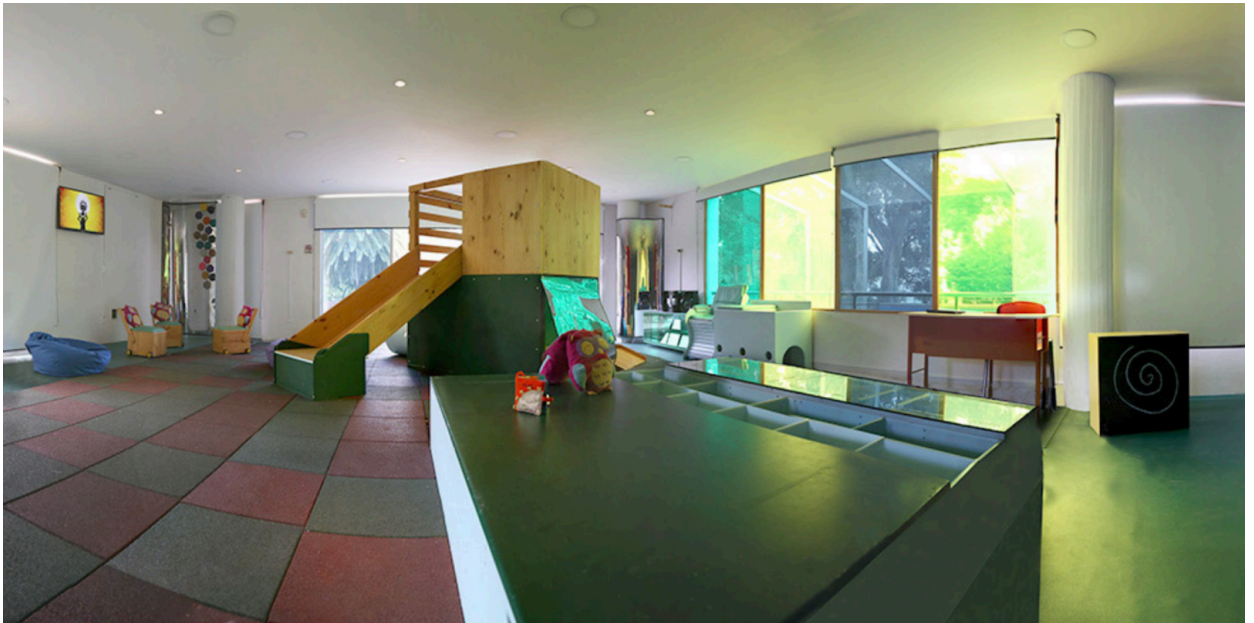
El parque, espacio adecuado Primera Infancia, Proyecto Nidos Arte en Primera Infancia, IDARTES. Bogotá, Colombia.