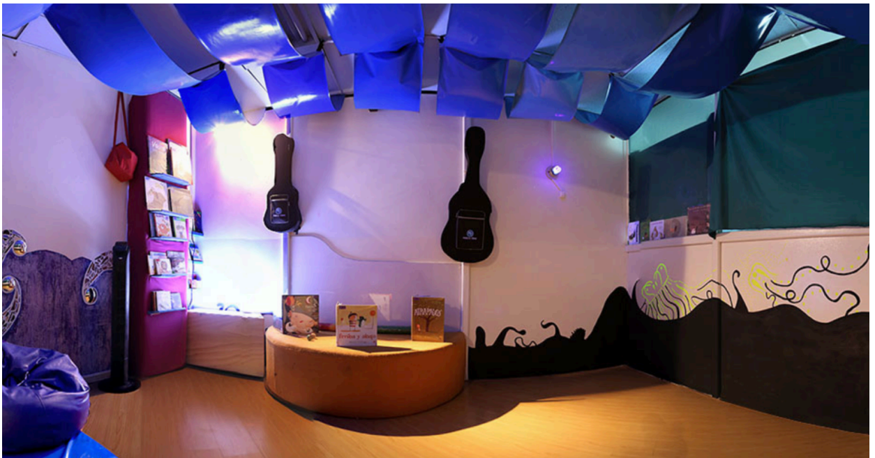
La onda, espacio adecuado Primera Infancia, Proyecto Nidos Arte en Primera Infancia, IDARTES. Bogotá, Colombia.