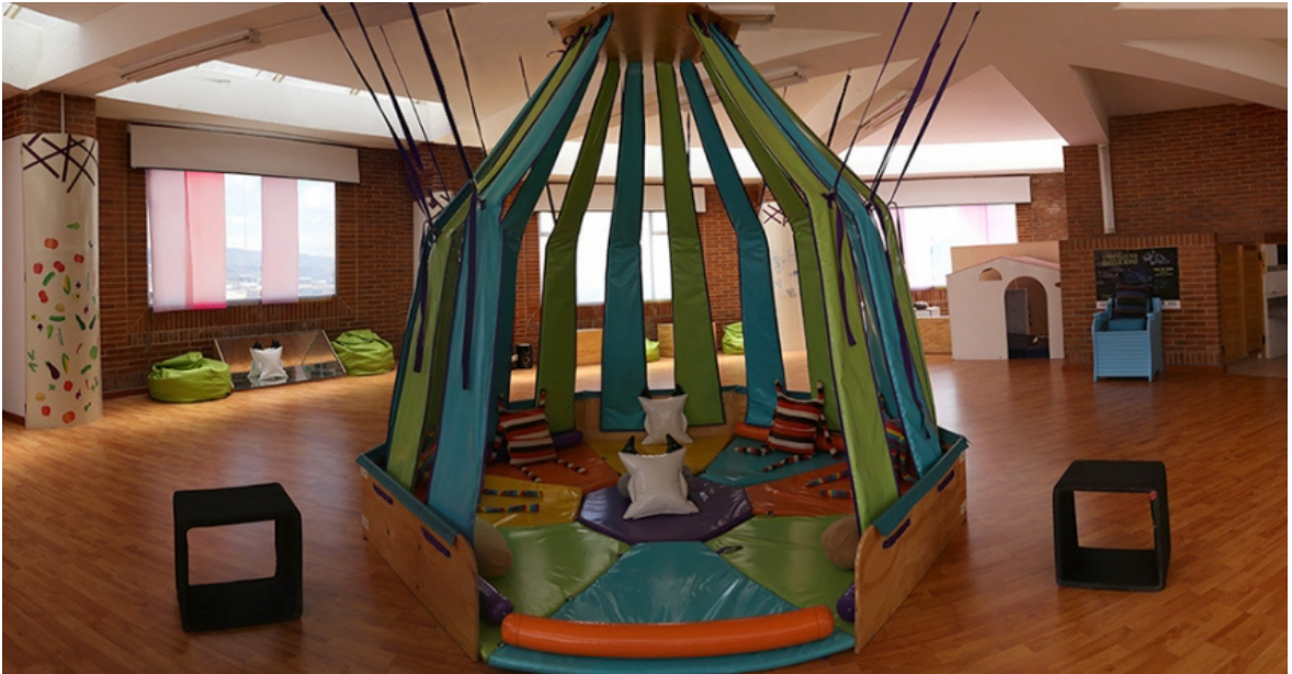
Nidos de Usme, espacio adecuado Primera Infancia, Proyecto Nidos Arte en Primera Infancia, IDARTES. Bogotá, Colombia.