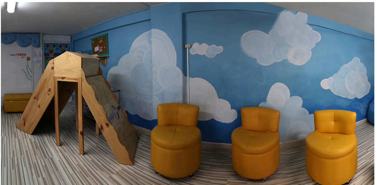
Entre Nubes, espacio adecuado Primera Infancia, Proyecto Nidos Arte en Primera Infancia, IDARTES. Bogotá, Colombia.