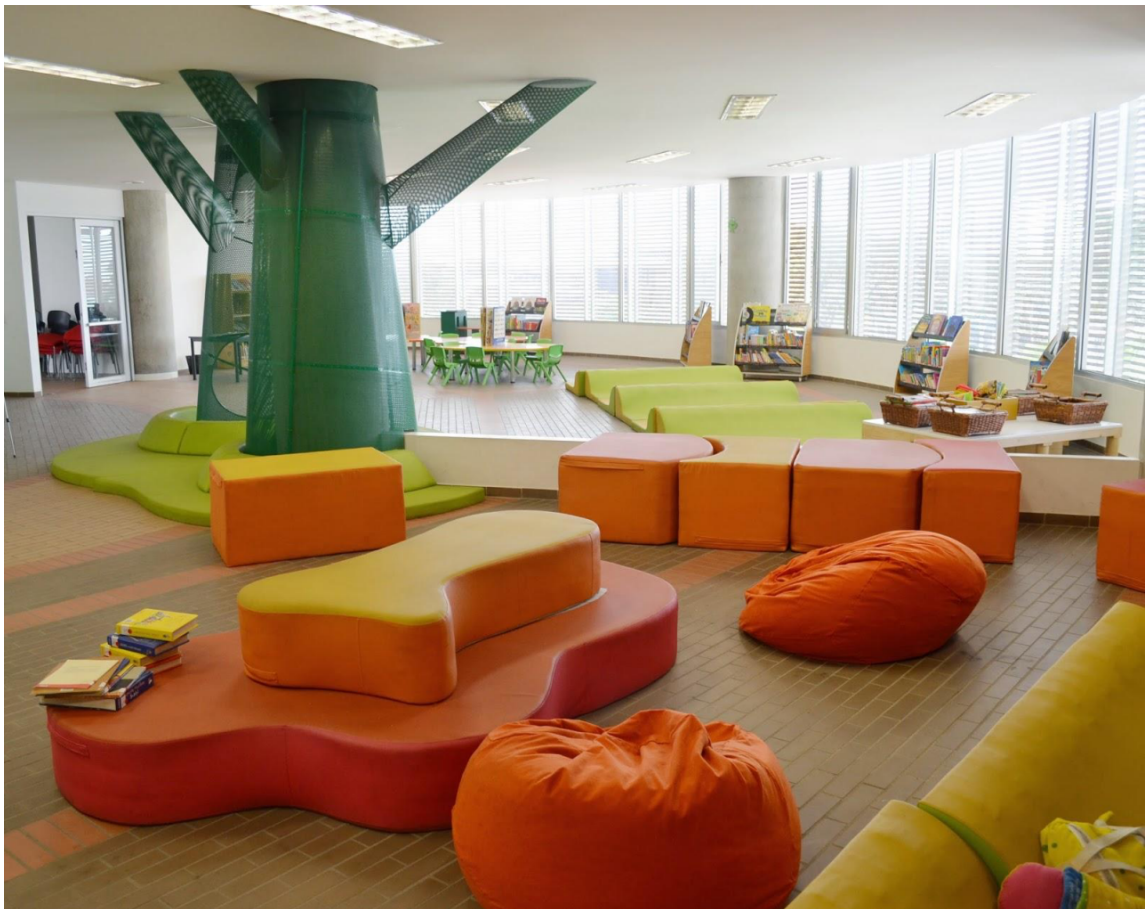
Biblioteca Ciudadela nuevo Latir, Cali, Colombia.

En el presente documento encontrará referentes visuales de algunos espacios para la lectura y los libros, diseñados e implementados especialmente para la primera infancia. Servirán de inspiración, guía y visualización, es importante reconocer que los espacios citados a continuación son solo ejemplos, el objetivo es que cada espacio sea particular y refleje la identidad del territorio y en lo posible aproveche la producción manual local.