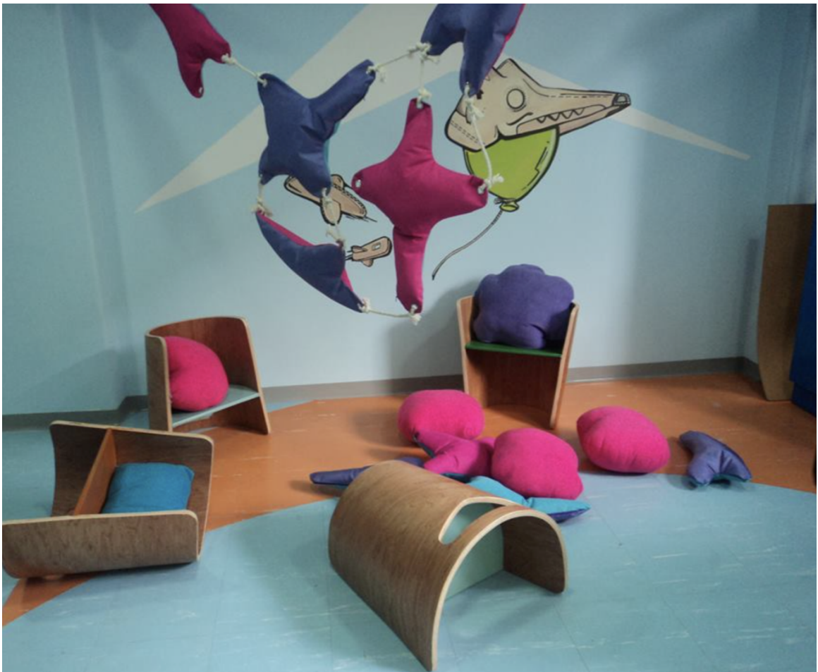
En las alturas, espacio adecuado Primera Infancia, Bogotá, Colombia.

El objetivo es que sirvan de ejemplo para los procesos territoriales.