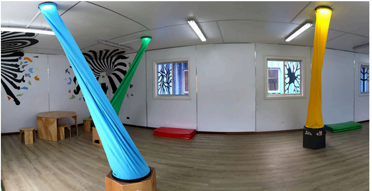
OP.TI.CO, espacio adecuado Primera Infancia, Proyecto Nidos Arte en Primera Infancia, IDARTES. Bogotá, Colombia.