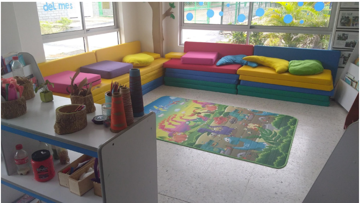
Sala de lectura CDI Tiempo Feliz, Barranquilla, Colombia.