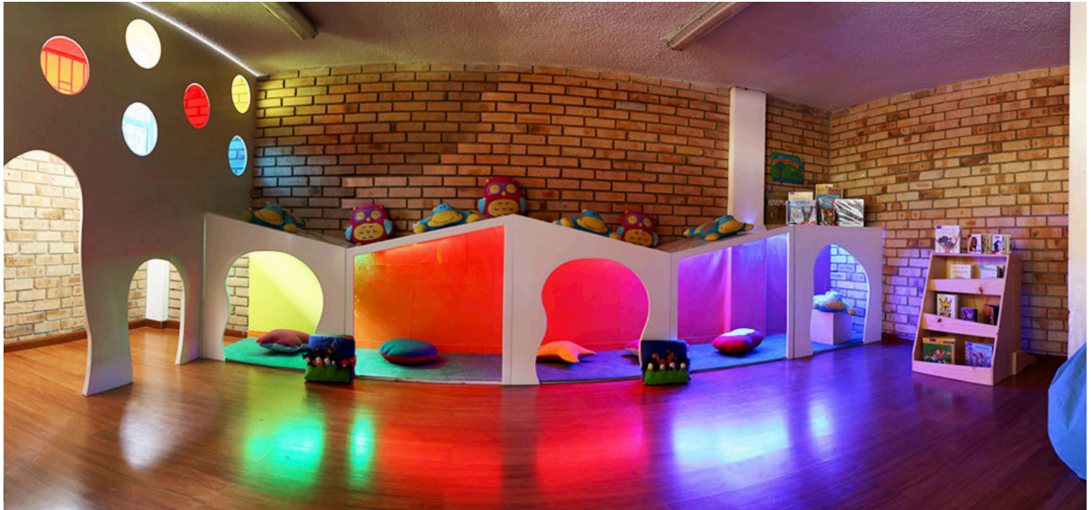
El laberinto, espacio adecuado Primera Infancia, Proyecto Nidos Arte en Primera Infancia, IDARTES. Bogotá, Colombia.