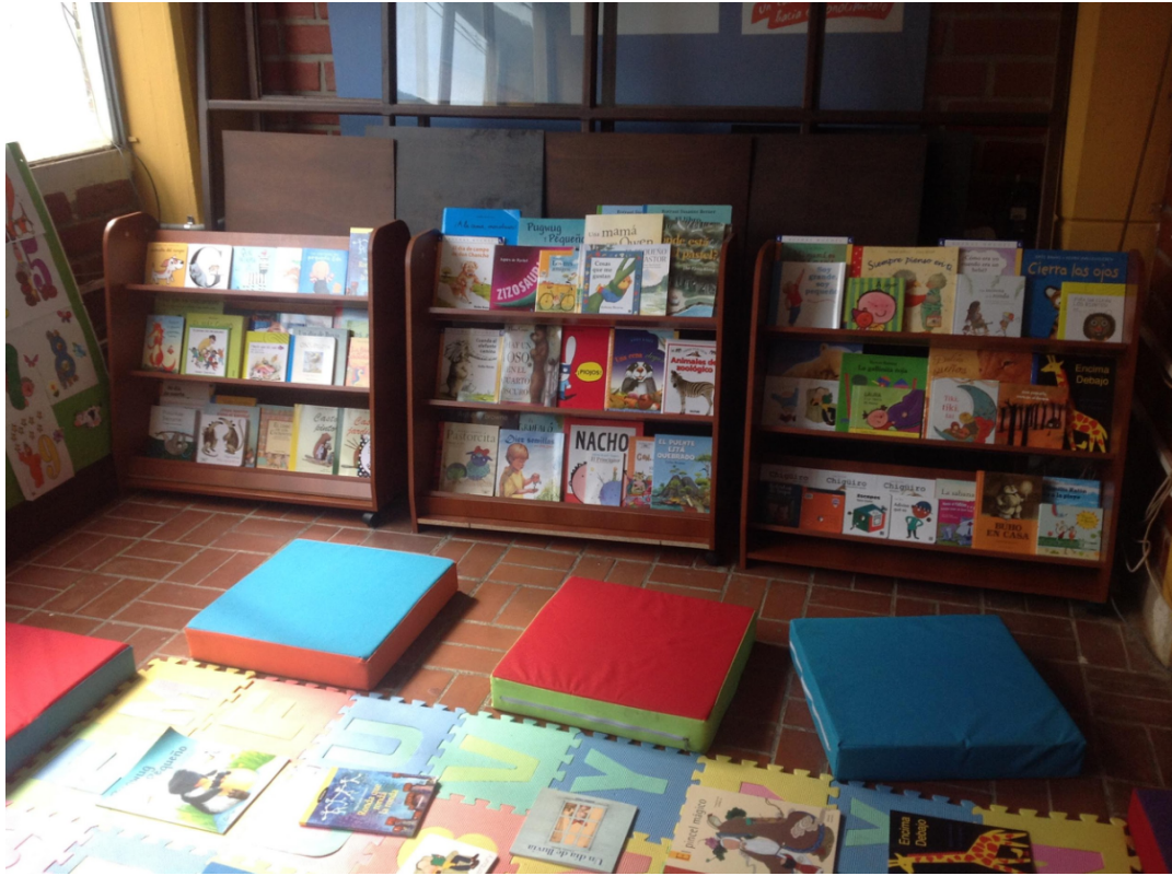
Sala de lectura, Antioquia, Colombia.