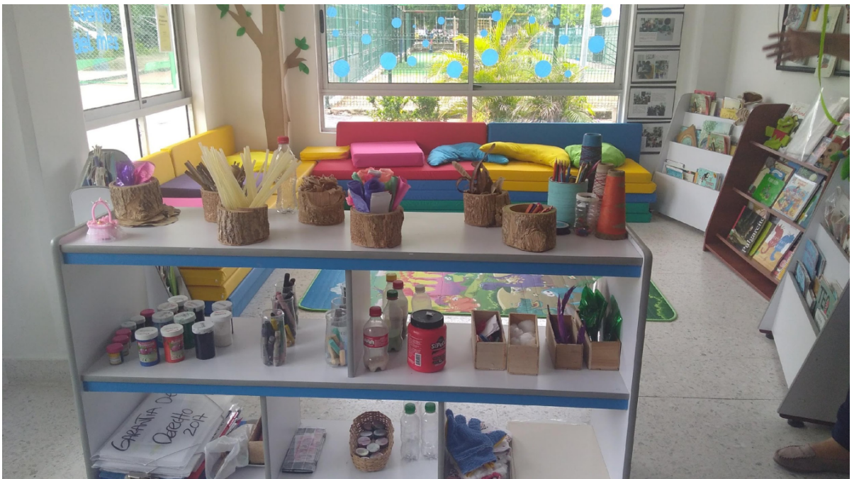
Sala de lectura CDI Tiempo Feliz, Barranquilla, Colombia.