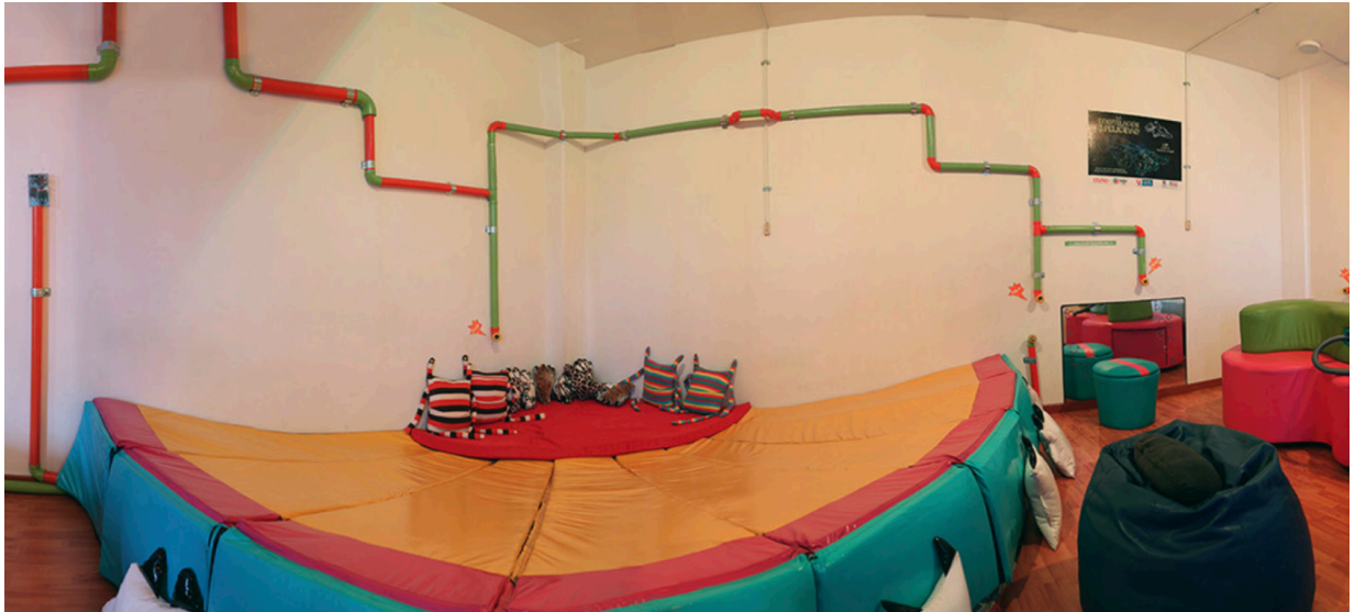
Lab, espacio adecuado Primera Infancia, Proyecto Nidos Arte en Primera Infancia, IDARTES. Bogotá, Colombia.