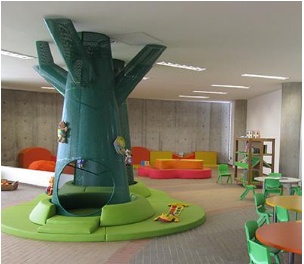
Biblioteca Ciudadela nuevo Latir, Cali, Colombia. http://mariaclarahenao.com/ciudadela-nuevo-latir/