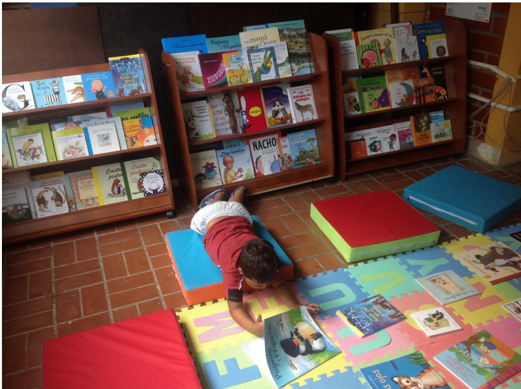
Sala de lectura, Antioquia, Colombia.