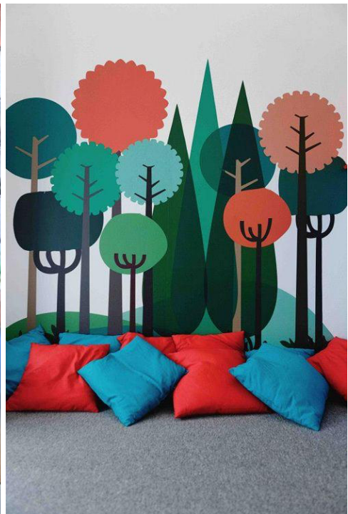
Rincón de lectura, http://www.auladeelena.com/2015/11/mi-regalo-de-cumpleanos-suelo-vinilico-y-sillon-de-lectura.html