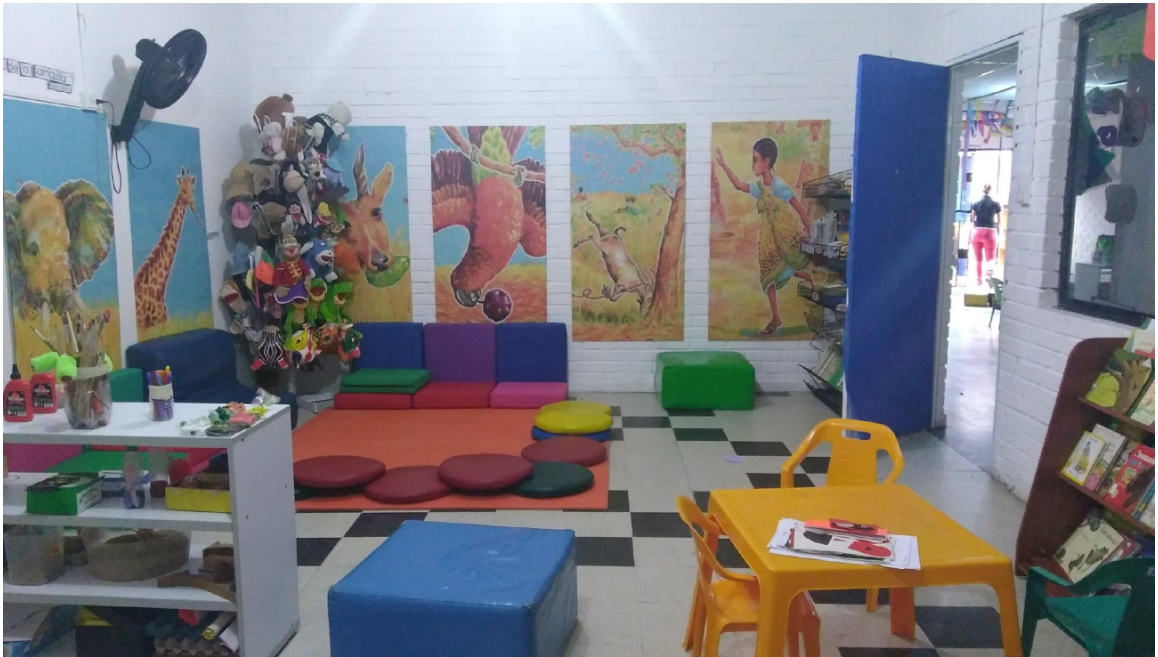
Sala de lectura CDI Tiempo Feliz, Barranquilla, Colombia.